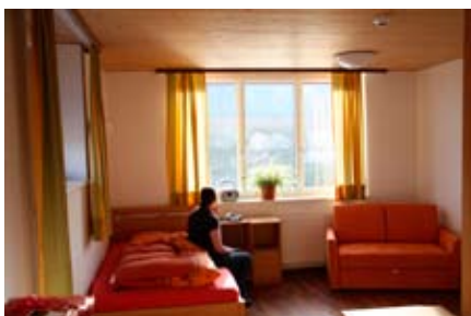
Das Krisenzimmer bietet Raum für Ruhe, um neue Kraft zu tanken

Dieses neue Angebot bietet die Möglichkeit und Perspektive, eine Krise bzw. schwierige Lebenssituation ohne stationären Aufenthalt im Krankenhaus zu bewältigen und zu stabilisieren. Zielgruppe sind grundsätzlich Menschen, die es daheim alleine nicht mehr schaffen und daher kurzfristig Unterstützung oder