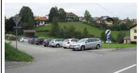
Ersatzparkplätze Zufahrt Steinfeld

Wir ersuchen besonders die Eltern der Kindergartenkinder den Werksverkehr der Firma Pisl nicht zu beeinträchtigen und den Firmenparkplatz der Firma Pisl nicht zum Halten oder Parken zu benutzen.